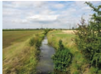
Gewässer mit Gewässerrandstreifen